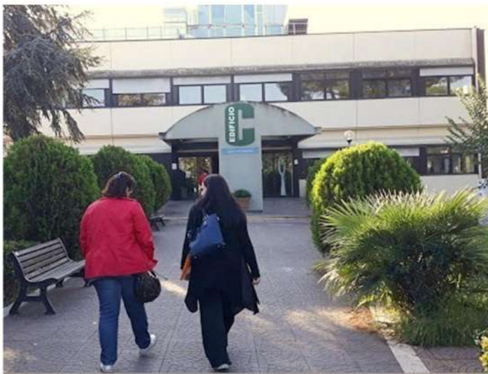
Ospedale Sandro Pertini

Q ualche anno fa, quando ero un libero cittadino, percorrevo spesso la via Tiburtina per ragioni di lavoro e nelle ore di intenso traffico, passando davanti alle carceri di Rebibbia spesse volte davvo precedenza alle auto che si immettevano sulla strada principale. La mia era una specie di cortesia della strada dovuta al traffico che creava immense file, e un senso di educazione stradale verso persone che lavoravano come me. Erano quasi tutti agenti penitenziari in divisa e proprio in quel momento ero preso da giudizi critici nei confronti dei reclusi della struttura penitenziaria. Guardo caso, quei giudizi che avanzavo verso i detenuti li ho visti qualche anno dopo rivoltati verso di me.