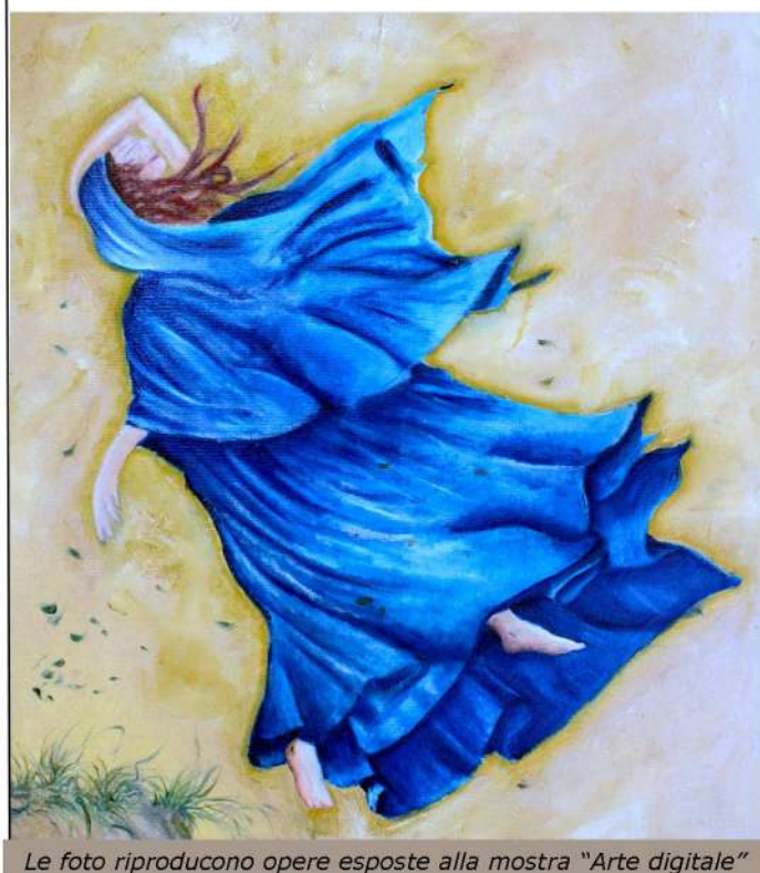
Le foto riproducono opere esposte alla mostra “Arte digitale”