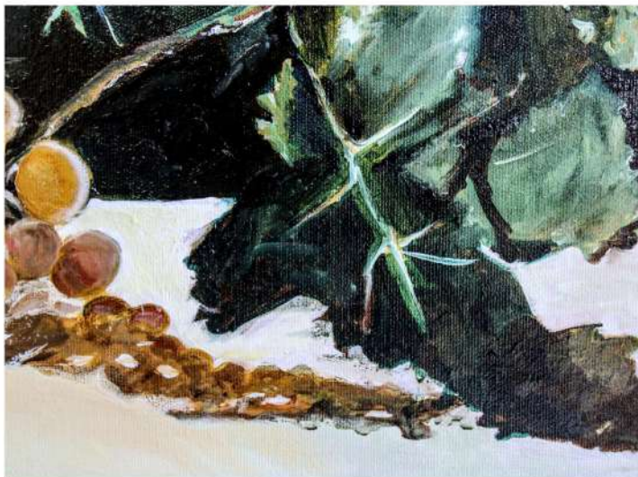
Le foto riproducono opere esposte alla mostra "Arte digitale"

L il laboratorio artistico è diventato, nel corso del tempo, un punto di riferimento per intraprendere un percorso di introspezione e crescita personale oltre che di acquisizione di competenze e abilità tecnico artistiche.