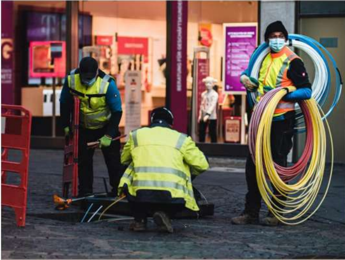
Detenuti impegnati nella posa della fibra ottica

A d un certo punto siamo arrivati a un bivio. Io ho preso il corridoio di sinistra, quello che portava all'uscita e loro quello opposto, che li riportava "dentro". Mi sono sentito male, soprattutto vedendo ragazzi così giovani e smarriti tornare alle loro celle. In quel momento mi sono ripromesso che avrei fatto qualcosa di concreto per loro. Da quel giorno mi sono impegnato ad attivare fondi per la formazione, a costruire comunicazione con il mondo Confindustria, sensibilizzare le imprese visto che molte non sanno minimamente delle agevolazioni previste per chi assume ex detenuti. Da lì è nato un legame forte con la realtà penitenziaria che non si è mai interrotto. Era il 2018, l'anno seguente abbiamo realizzato due corsi. Ne abbiamo tenuti altri all'inizio del 2020, quando stava per scoppiare la pandemia".