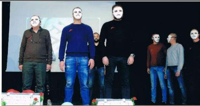
Foto dello spettacolo al teatro di Rebibbia

Spettacolo dei detenuti per aderire alla Giornata internazionale sulla violenza contro le donne